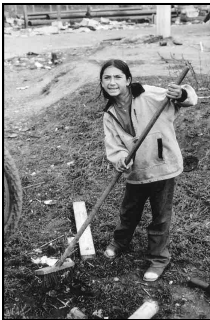
Ci dessus, cet adolescent rassemble, en contrebas de sa baraque un tas de détritus

Malgré la crasse, la boue et autres saletés permanentes, on observe cependant une frénésie du nettoyage. Dans ces lieux sans équipement domestique, sans ramassage des ordures, les mauvaises odeurs se déposent constamment sur ses occupants. Dans des émissions radiophoniques de travail de mémoire sur les anciens bidonvilles, était déjà signalé ce combat quotidien 23 . Malgré ces conditions d'hygiène déplorables, on constate que le combat pour rendre l'espace plus « digne » est permanent chez les habitants. Ainsi, dans les bidonvilles actuels, le dimanche, qui est souvent pour ses occupants un jour de repos, est également pour les femmes et les filles, un grand jour de nettoyage.