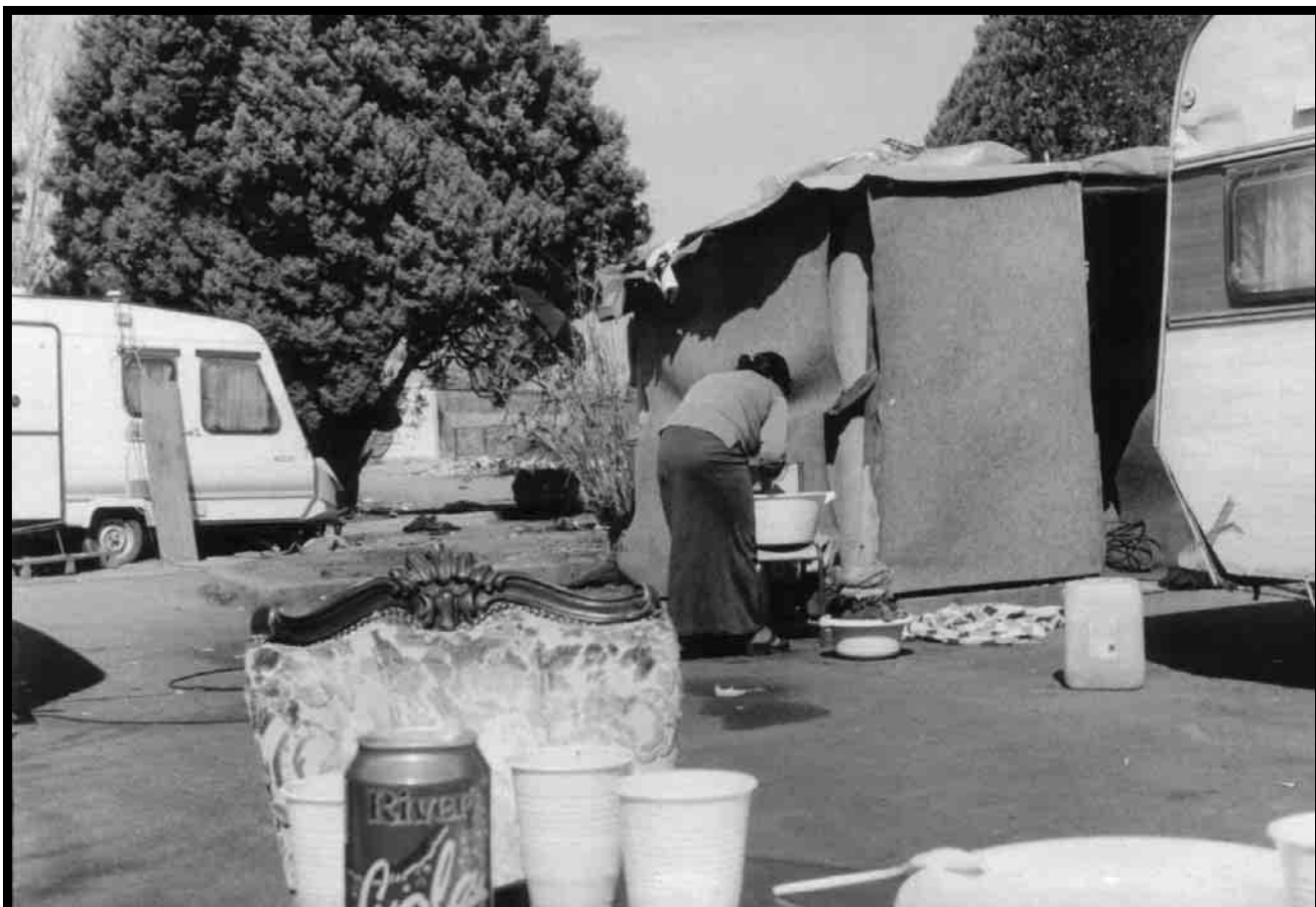
Un bar informel sur le terrain de Surville. Les Roumains de Craiova s'y rendent pour discuter et boire un verre.

place . La pratique de petites activités de survie sur l'espace public est toutefois encore tolérée par les institutions en raison de la pitié que ces démunis implorent. « Les médias comme la population balancent entre la compassion misérabiliste entretenue par le spectacle d'un dénuement profond et le rejet d'une population sur laquelle pèse toujours une souillure possible » 107 .