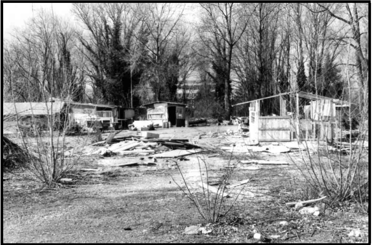
Ci-dessus, des baraques détruites. En mars 2004, les forces de l'ordre s'en sont pris aux baraques pour intimider les habitants des bidonvilles.

Aux éléments rappelés ci-dessus, nous pouvons également signaler qu'à toutes ces nuisances, s'ajoute souvent la pollution sonore qui entoure ces lieux, de jour comme de nuit : ici un avertisseur sonore d'une grue de la déchetterie de ferraille à proximité de leur installation 25 , là un échangeur autoroutier et une voix ferrée destinée au fret. Sur ces terrains, les conditions sanitaires et d'hygiène sont déplorables comme peuvent en témoigner les articles de presse 26 et les rapports