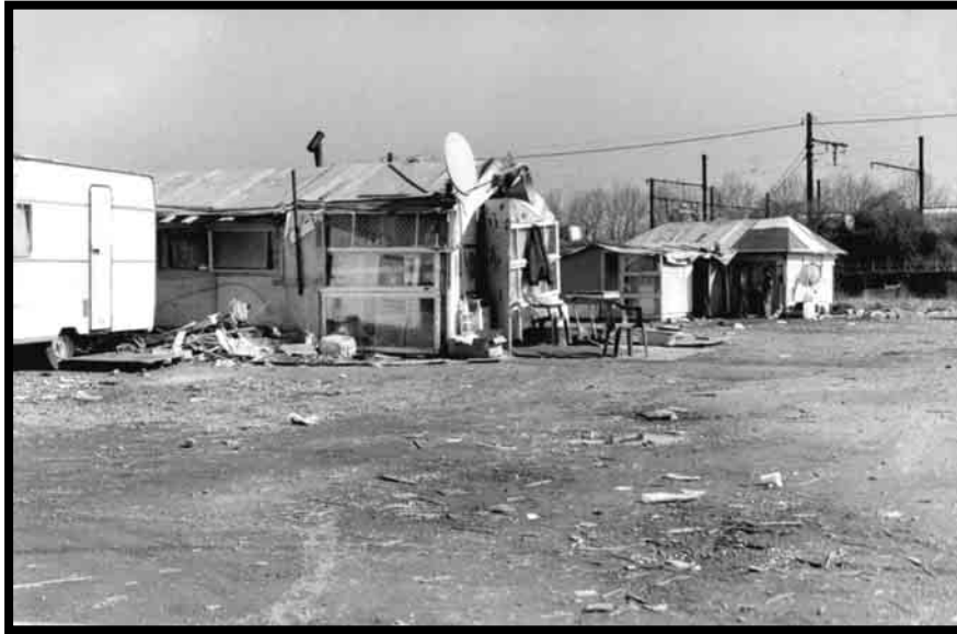
A gauche : des baraques de demandeurs d'asile conventionnel provenant d'Ex-Yougoslavie