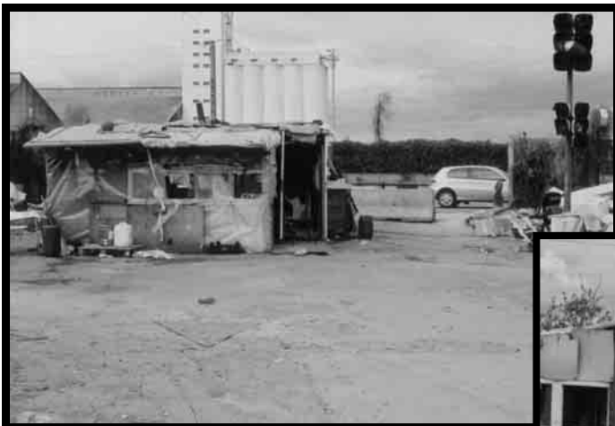
Cette partie du bidonville de Surville existe depuis 2002

Les ex-Yougoslaves ont souvent eu des solutions de relogement lorsqu'ils étaient avenue de Böhlen. Ceux qui n'avaient pas eu cette opportunité s'étaient alors dirigés sur un coin du bidonville de Surville .