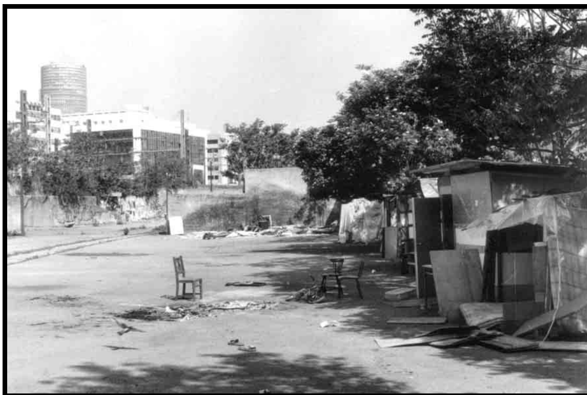
Dans des lieux extrêmement centraux, les marges se développent, comme ici, rue M. Flandrin (Lyon 3 ème ) à l’ombre du « Crayon »